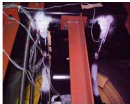
加速度センサ・歪ゲージを被試験体に装着。カラーチェックで亀裂を観察