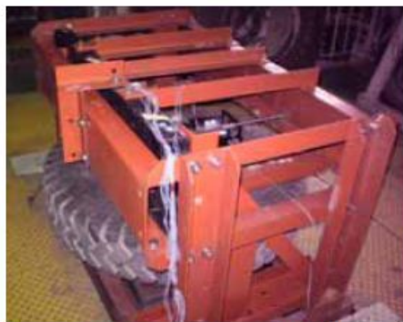
スペアタイヤキャリアと取付ブラケットの振動試験の様子

スペアタイヤキャリアメーカーである当社は、タイヤ脱落防止保証のために振動試験を行っています。 この加振装置は、広く他の振動試験にもお使いいただくことができます。